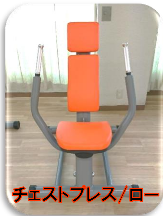
チェストプレス/ロー

立ち上がる・座る・しゃがむ・ 歩くなど、日常生活に欠か せない動作に必要な筋力を 強化します