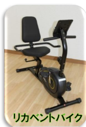
リカレントバイク