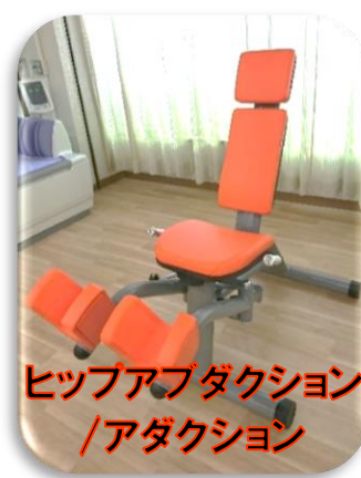
ヒップアブダクション /アダクション